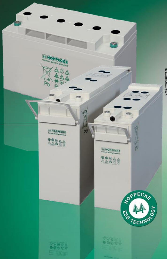
Similar to illustration

Сыктывкар (8212)25-95-17 Тамбов (4752)50-40-97 Тверь (4822)63-31-35 Тольятти (8482)63-91-07 Томск (3822)98-41-53 Тула (4872)33-79-87 Тюмень (3452)66-21-18 Ульяновск (8422)24-23-59 Улан-Удэ (3012)59-97-51 Уфа (347)229-48-12 Хабаровск (4212)92-98-04 Чебоксары (8352)28-53-07 Челябинск (351)202-03-61 Череповец (8202)49-02-64 Чита (3022)38-34-83 Якутск (4112)23-90-97 Ярославль (4852)69-52-93 Казахстан (772)734-952-31