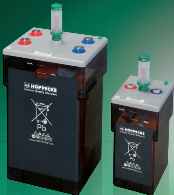
Изображение соответствует продукции АquaGen® опционально

Сыктывкар (8212)25-95-17 Тамбов (4752)50-40-97 Тверь (4822)63-31-35 Тольятти (8482)63-91-07 Томск (3822)98-41-53 Тула (4872)33-79-87 Тюмень (3452)66-21-18 Ульяновск (8422)24-23-59 Улан-Удэ (3012)59-97-51 Уфа (347)229-48-12 Хабаровск (4212)92-98-04 Чебоксары (8352)28-53-07 Челябинск (351)202-03-61 Череповец (8202)49-02-64 Чита (3022)38-34-83 Якутск (4112)23-90-97 Ярославль (4852)69-52-93 Казахстан (772)734-952-31