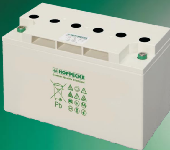
Similar to illustration

Сыктывкар (8212)25-95-17 Тамбов (4752)50-40-97 Тверь (4822)63-31-35 Тольятти (8482)63-91-07 Томск (3822)98-41-53 Тула (4872)33-79-87 Тюмень (3452)66-21-18 Ульяновск (8422)24-23-59 Улан-Удэ (3012)59-97-51 Уфа (347)229-48-12 Хабаровск (4212)92-98-04 Чебоксары (8352)28-53-07 Челябинск (351)202-03-61 Череповец (8202)49-02-64 Чита (3022)38-34-83 Якутск (4112)23-90-97 Ярославль (4852)69-52-93 Казахстан (772)734-952-31